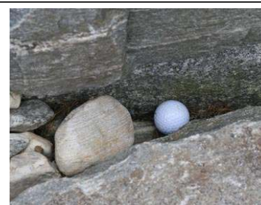
Så får vi håpe at lukka er betre neste år...